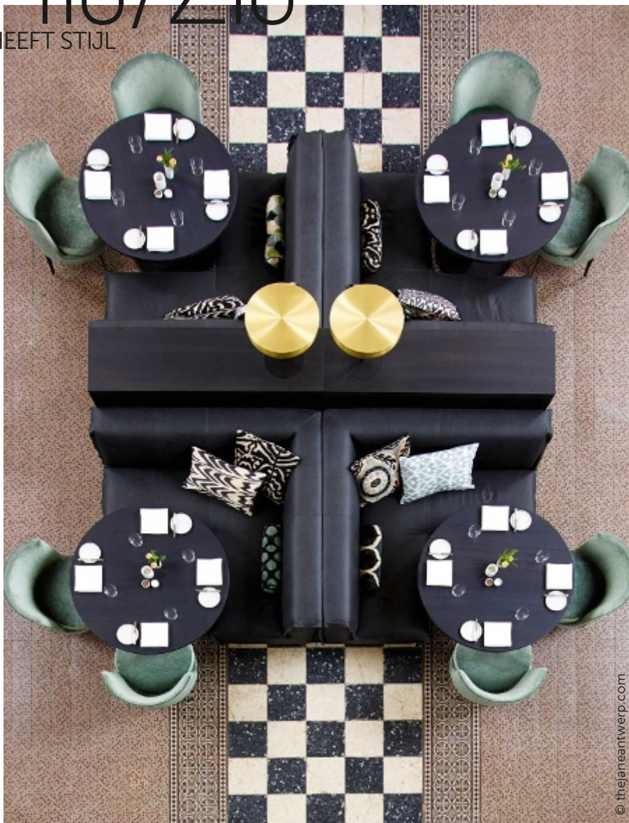
Tekst Jackie Oomen